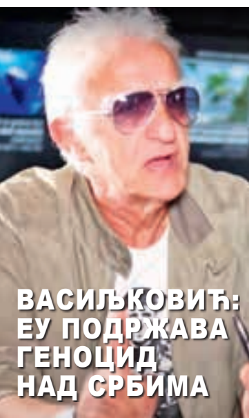
ВАСИЉКОВИЋ: ЕУ ПОДРЖАВА ГЕНОЦИД НАД СРБИМА