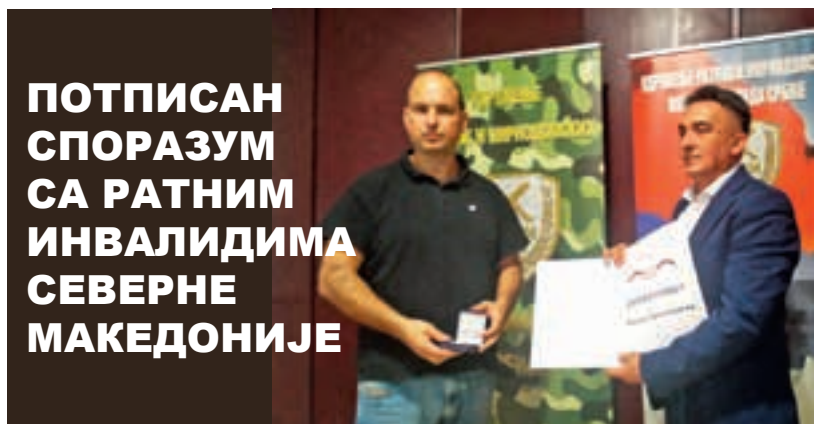
ПОТПИСАН СПОРАЗУМ СА РАТНИМ ИНВАЛИДИМА СЕВЕРНЕ МАКЕДОНИЈЕ