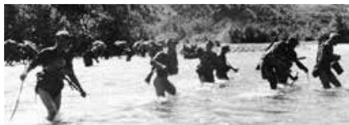
НЕМЦИ И УСТАШЕ БЕЖЕ ПРЕКО ДРИНЕ