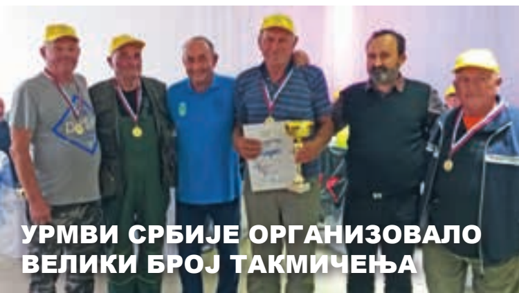
УРМВИ СРБИЈЕ ОРГАНИЗОВАЛО ВЕЛИКИ БРОЈ ТАКМИЧЕЊА